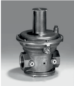
Umlaufregler Typ: KROMSCHRÖDER VAR