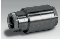
Gasrücktrittsicherung Typ: KROMSCHRÖDER GRS

Brenner in industriellen Thermoprozess- und Heizungsanlagen sowie Blockheizkraftwerken benötigen einen minimalen Versorgungsdruck. Steht am Brenner nicht genügend Gasdruck zur Verfügung, beispielsweise durch hohe Druckverluste im Leitungssystem, kann der Einsatz einer Gasdruckerhöhungseinrichtung notwendig werden. Besonders bei Biogasanlagen, in denen der Gasdruck verfahrensbedingt sehr niedrig ist, bietet sich der Einsatz an, wenn direkt ein Verbraucher – etwa ein BHKW – betrieben wird.